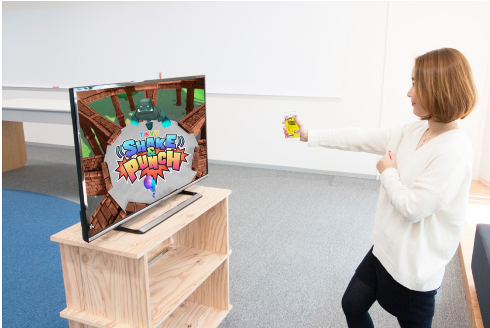
TOVY体験ブースでのデモコンテンツ体験イメージ